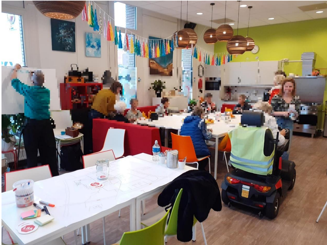
Sfeerindruk bij de Boshoeck

Op 18 oktober 2024 kwamen we in de Boshoeck in Bospoort bij elkaar om samen te praten over het wonen en leven in jullie wijk. In totaal waren er twintig mensen uit de buurt. Samen hebben we besproken wat wonen en leven in Bospoort fijn maakt, en wat er in de toekomst anders mag. We hebben veel interessante dingen geleerd over de wijk. Hieronder delen we dit.