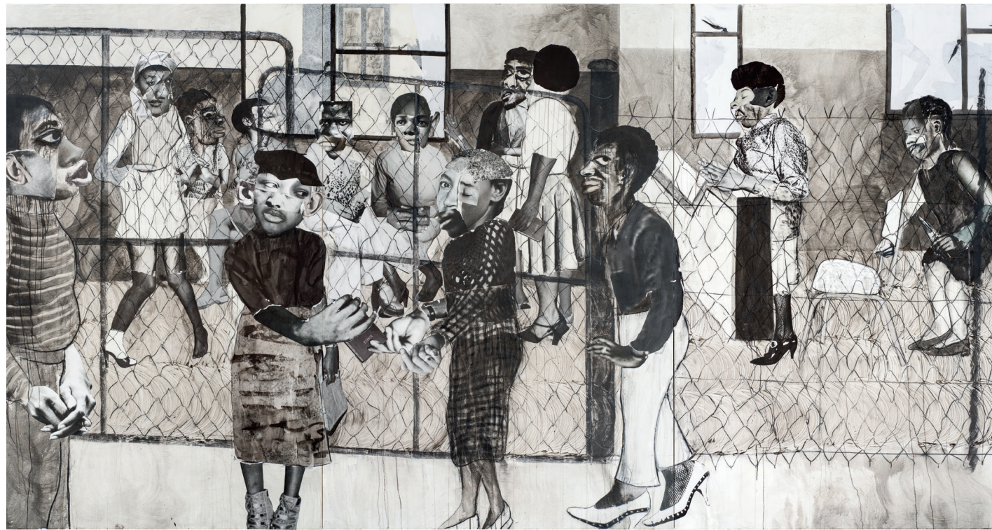
▲ Sontaga by Neo Matloga (ABN AMRO Kunstruimte)