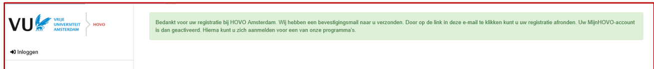
Afbeelding 3 – registratie

‘Bedankt voor uw registratie bij HOVO Amsterdam.’