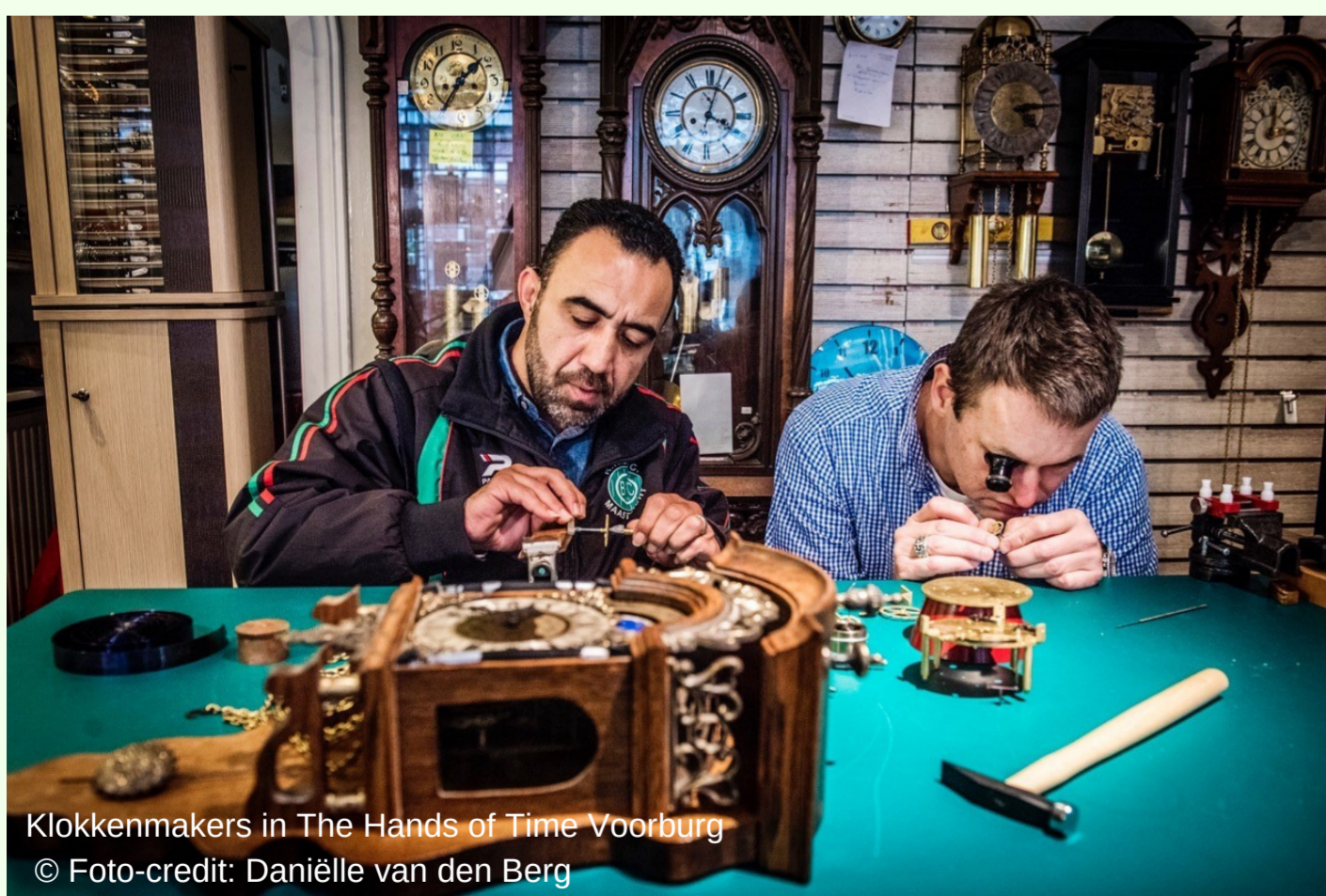
Klokkenmakers in The Hands of Time Voorburg