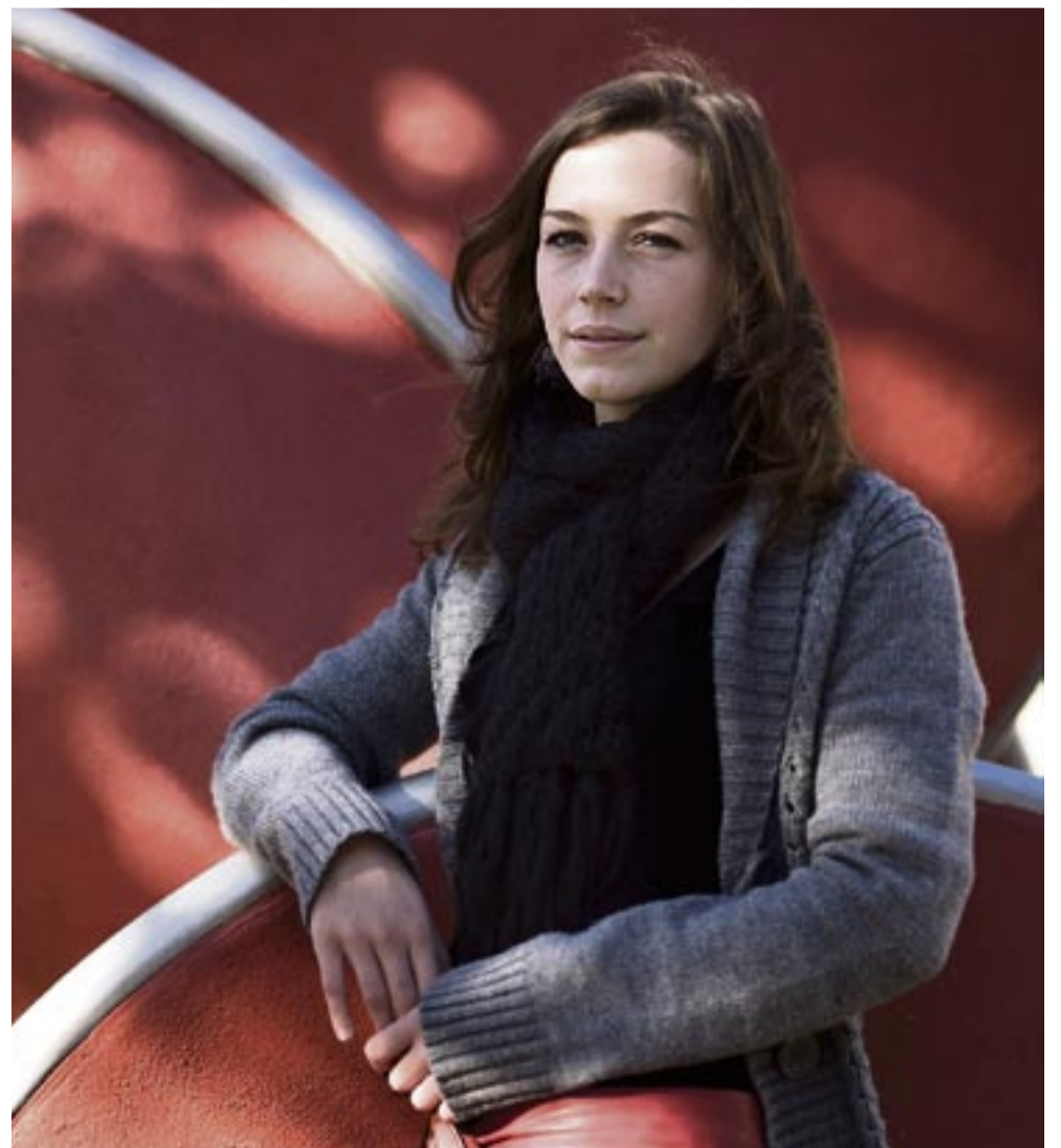
'Het is mooi om een band met die kinderen te hebben'

Reageren? Mail naar redactie@advalvas.vu.nl .