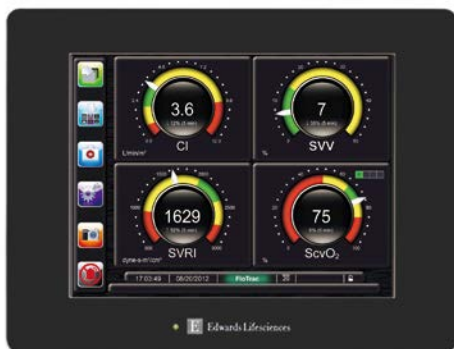
EV1000 クリティカルケアモニター

EV1000 クリティカルケアモニター、ヘモスフィア、ビジレオモニター * 、ビジランスヘモダイナミックモニター * に対応しています。