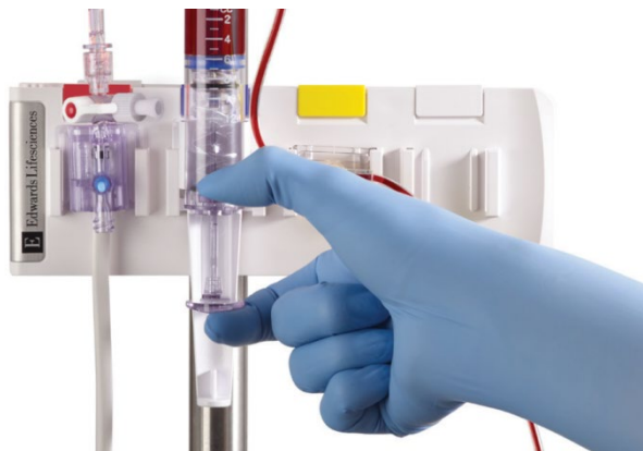
Support TruClip montré avec le système clos de prélèvement sanguin VAMP.

Le support TruClip peut être utilisé pour aider à réduire l'encombrement du matériel dans les salles d'opération, les unités de soins intensifs, les services d'urgence et les laboratoires de cathétérisme cardiaque.