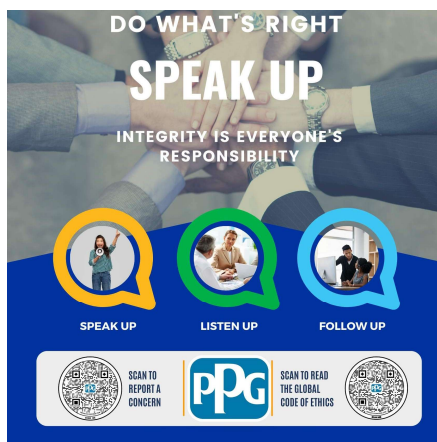
Speak Up Poster