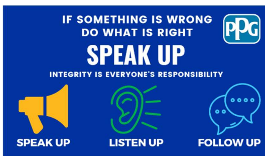
Carte de portefeuille