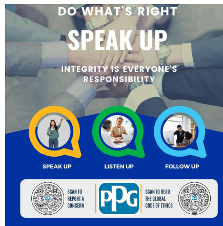
Poster Speak Up