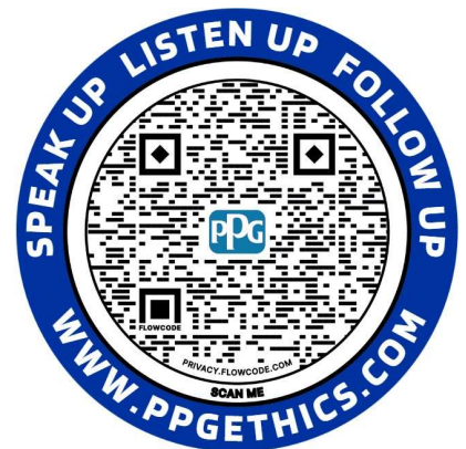
Ligne assistance éthique Autocollant

Vous pouvez commander ces documents sur le site SharePoint de PPG consacré à l'éthique et à la conformité.