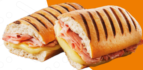
Panini se šunkou a sýrem Panini with Ham and Cheese Panini z szynką i serem