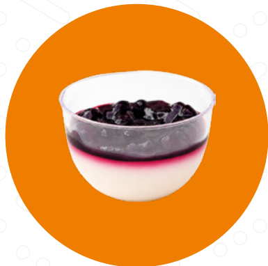
Borůvková panna cotta Blueberry Panna Cotta Panna cotta jagodowa