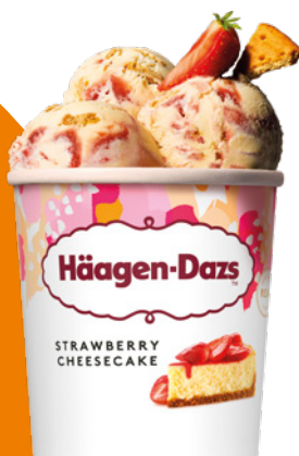
jahodový cheesecake strawberry cheesecake sernik truskawkowy