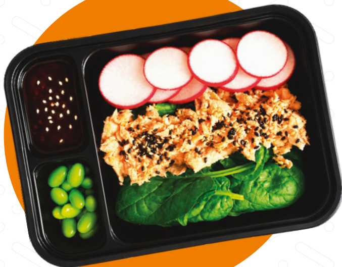
Poké Teriyaki losos Poké Teriyaki Salmon Poké Teriyaki losoś