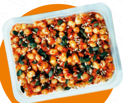
Noky s pestem ze sušených rajčat Gnocchi With Sun-Dried Tomato Pesto Gnocchi z pesto z suszonych pomidorów