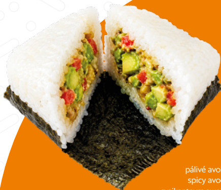
Sushi Snack Onigiri