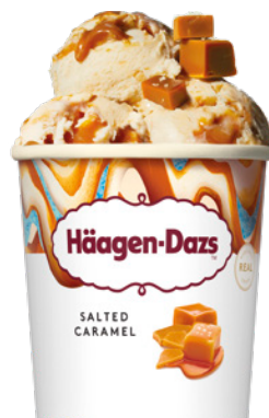
slaný karamel salted caramel słony karmel