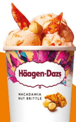
makadamový ořech macadamia nut brittle orzech makadamia

slaný karamel • salted caramel • słony karmel (3, 7)