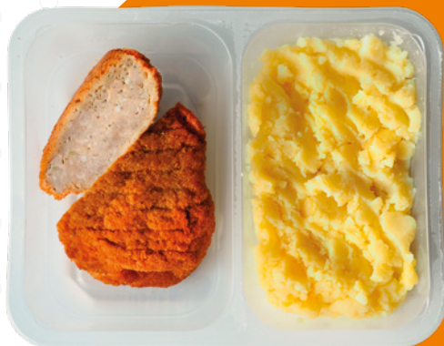
Holandský řízek se šťouchanými bramborami Dutch-Style Schnitzel with Mashed Potatoes Kotlet holenderski z ziemniakami tłuczonymi