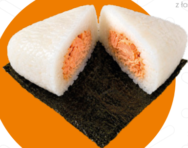
losos salmon z lososiem