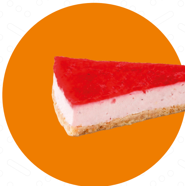
Jahodový cheesecake Strawberry Cheesecake Sernik truskawkowy