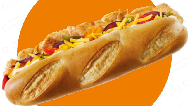
Fajitas bageta Fajita baguette Fajitas bagietka