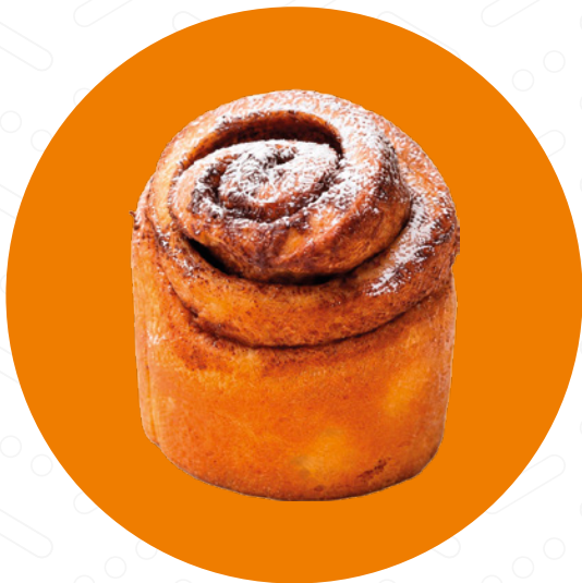
Skořicový šnek Cinnamon Roll Cynamonowy ślimak