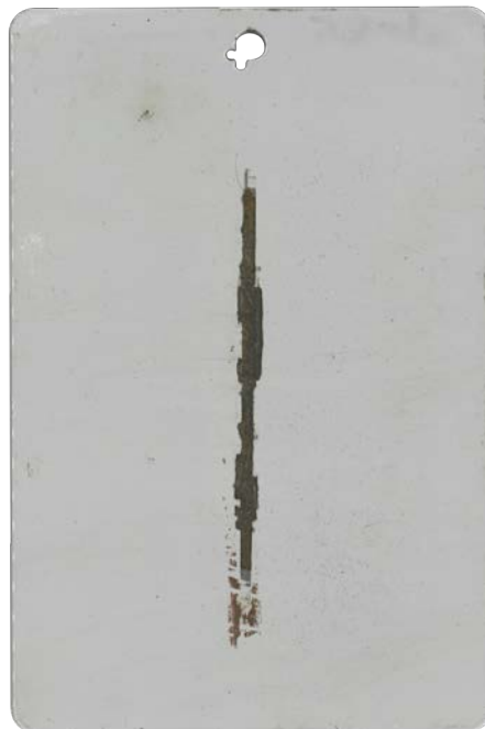
Zweischicht-System Grundierung + Decklack nach 720 Std. NSS

Schutzschichten sind der dauerhafteste Schutz vor Korrosion. Es gibt jedoch einen Leistungsunterschied zwischen einschichtigen und zweischichtigen Beschichtungssystemen.