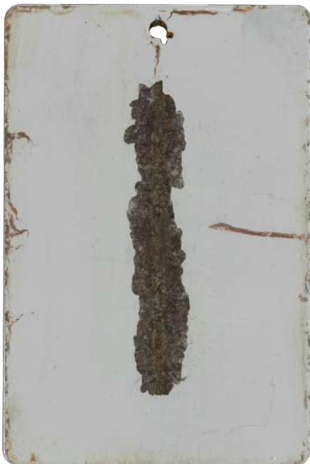
Einschicht-System nur Decklack nach 720 Std. NSS