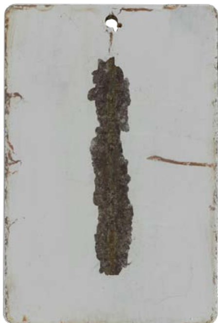
System jednowarstwowej farby nawierzchniowej po 720 godz. testu w obojętnej mgle solnej