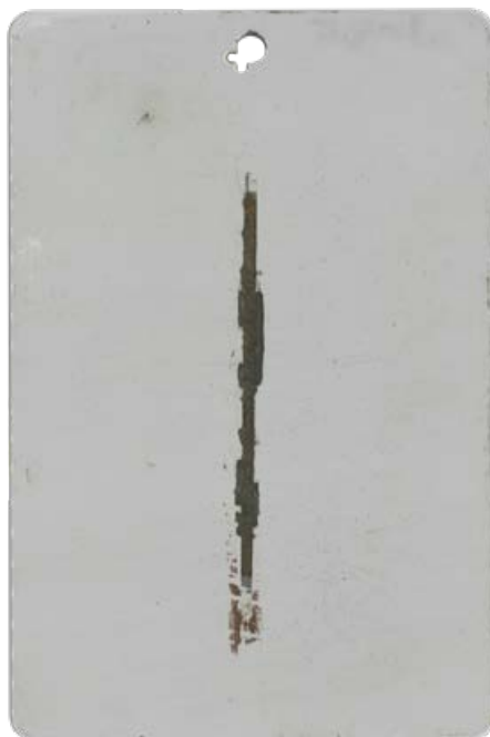
System dwuwarstwowy (podkład + farba nawierzchniowa) po 720 godz. testu w obojętnej mgle solnej

Warstwy ochronne to najtrwalsze zabezpieczenie przed korozją. Istnieje jednak różnica skuteczności między systemami powłok jedno- i dwuwarstwowych.