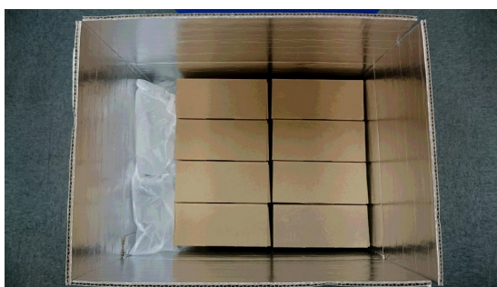
【白い段ボールにインスピリス専用輸送箱を梱包した状態】