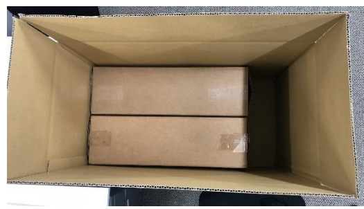
【専用輸送箱を段ボールに詰めた状態】