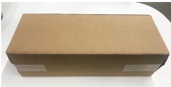
【INTUITY Elite 専用輸送箱を梱包した状態】