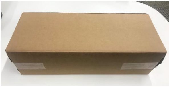
【INTUITY Elite 専用輸送箱】