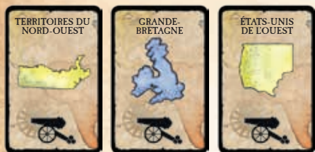
3 cartes du même symbole de régiment

Vous devrez essayer de collectionner des séries de trois cartes dans n'importe laquelle des combinaisons suivantes :