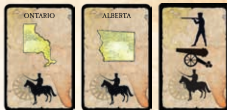
N'importe quelle combinaison de 2 symboles de régiment et un « joker »